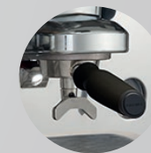
Portafiltro PRESTIGE Portafilter PRESTIGE