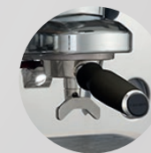
Portafiltro PRESTIGE+ Portafilter PRESTIGE+

Both versions are equipped with Faema adjustable thermal system. Only PRESTIGE+ has external knobs on the cupwarmer to be more functional and easy to access.