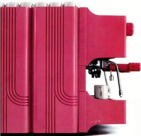
Prestige '70. Vista laterale dal design distintivo. Prestige '70. Side view with a distinctive design.